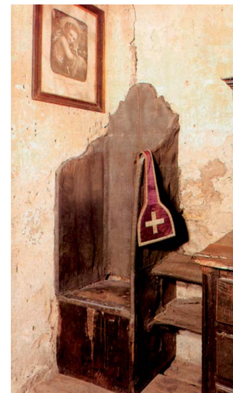
Spovednica sv. Janeza Vianney-a, arškega župnika

Že takoj drugi teden po prihodu v Planino je 10. 8. 1952 pri oznanilih zapisal in oznanil: »Za praznik Marijinega vnebovzeta še prav posebej vabljeni k sv. obhajilu, zlasti moški. Priložnost za spoved je dana vsak dan zjutraj pred mašo in po njej. Pa vedno tudi zvečer pred vsakim zapovedanim praznikom in ob sobotah zvečer. Po potrebi tudi izven tega časa.« Vedeti moramo, da so bile tedaj maše zjutraj. Ob začetku šolskega leta je 14. 9. 1952 oznanil: »Za začetek šole bo tudi spoved za vse učence v soboto po šoli dopoldne in popoldne.« Pred praznikom vseh svetnikov 19. 10. 1952 pa: »Bližajo se vsi sveti; zato je prav, da pride že prihodnje nedeljo šolska mladina k svetim zakramentom, ker bo to o vseh svetih težje priti na vrsto. V soboto dopoldne in popoldne lahko pridejo učenci kar po šoli. Sicer bom pa ob nedeljah in praznikih vsaj eno uro pred začetkom sv. maše